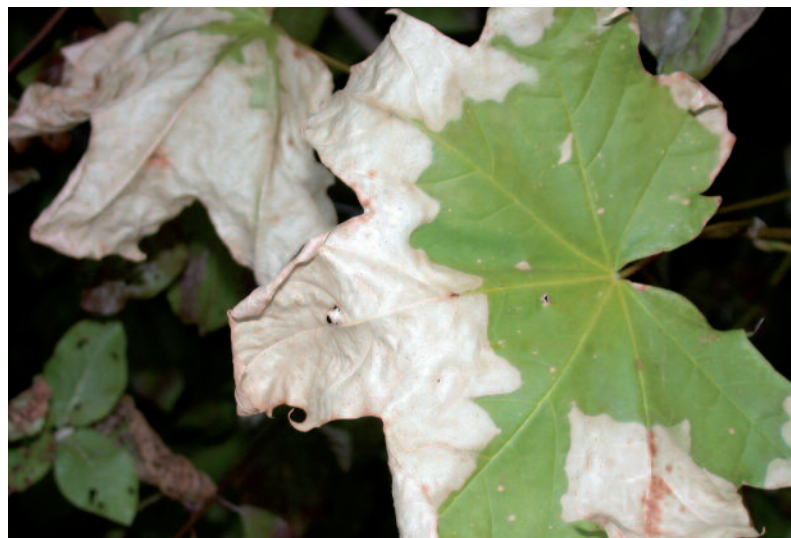
Vertrocknungserscheinungen an heimischem Ahorn als Folge der Dürre im Sommer 2003

So werden die unterschiedlichen Qualitäten von Monitoring, manipulativen Experimenten und Modellierungen bzw. Simulationen optimal vernetzt. Die im Verbund erzielten, grundlegenden Forschungsergebnisse bieten Einsatzmöglichkeiten in Wirtschaft und Gesellschaft, beispielsweise für Forst- und Landwirtschaft, Prognose von Naturgefahren, Naturschutz, Raumplanung und Wasserwirtschaft. Damit übernimmt dieses Vorhaben Bayerns eine Vorreiterrolle in der Klimafolgenforschung in Deutschland.