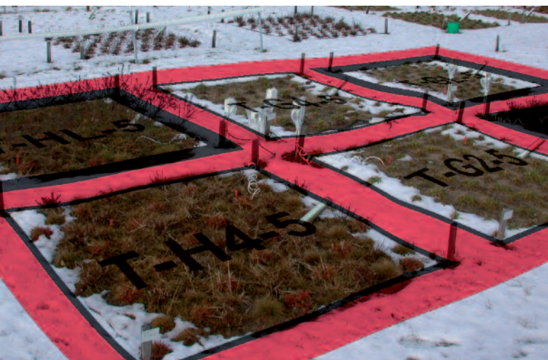
Experimentfläche zu klimatischen Extremereignissen (EVENT-Experiment an der Universität Bayreuth)

und langlebige Modellökosysteme z.B. Wälder, Grünländer, Gewässer beziehen!